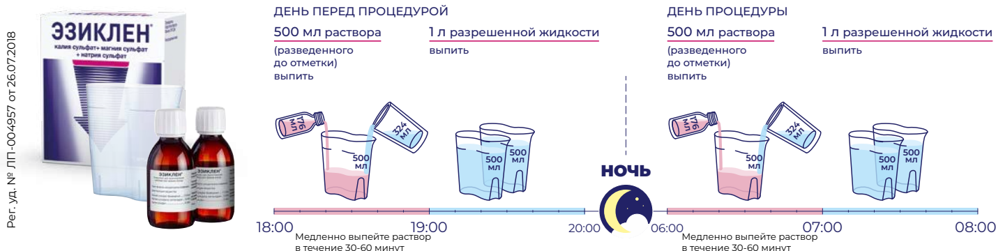
Схема ДВУХЭТАПНОГО приема препарата, если колоноскопия назначена на ПЕРВУЮ половину дня (до 13:00)**

Схема приема препарата в режиме дробного применения в случае, если процедура назначена, например, на 10 ч утра